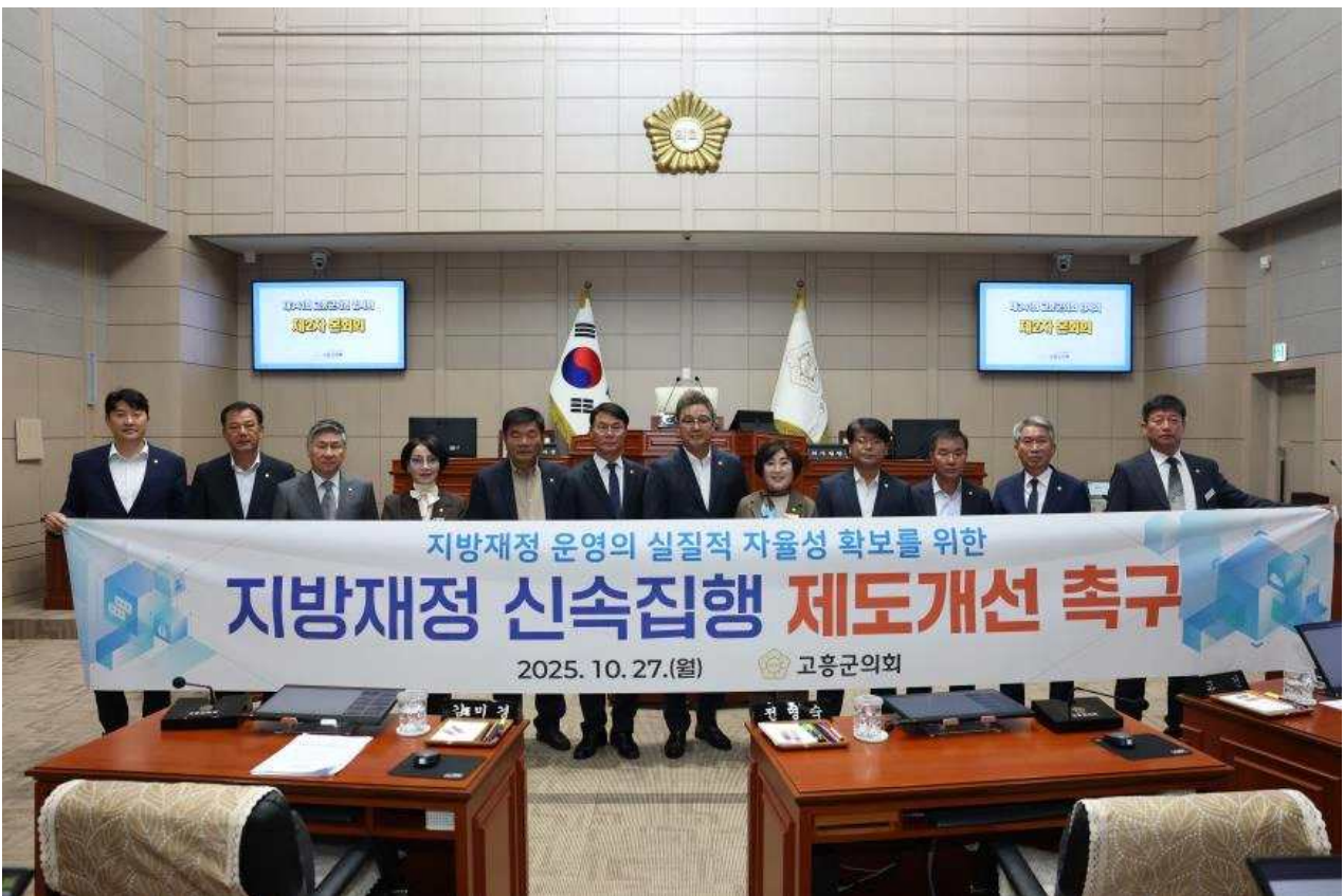
▲ '지방재정 신속집행 제도개선 촉구 건의안'가결 후 사진촬영을 하고 있다.