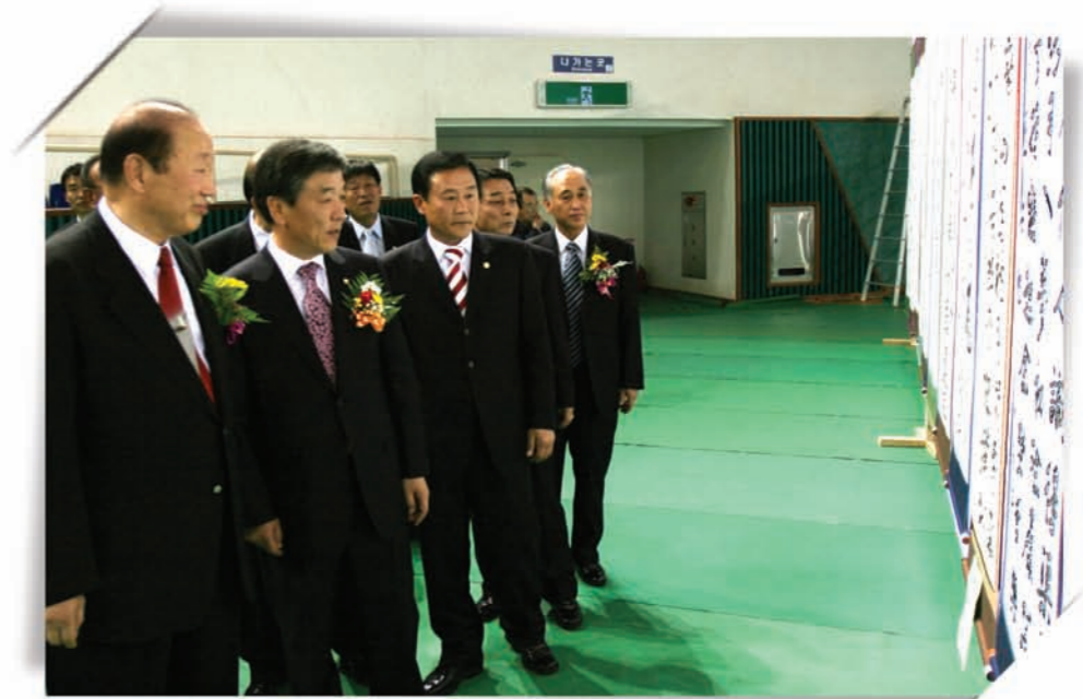
* 제4회 전라남도 서예전람회(2006. 10. 28)