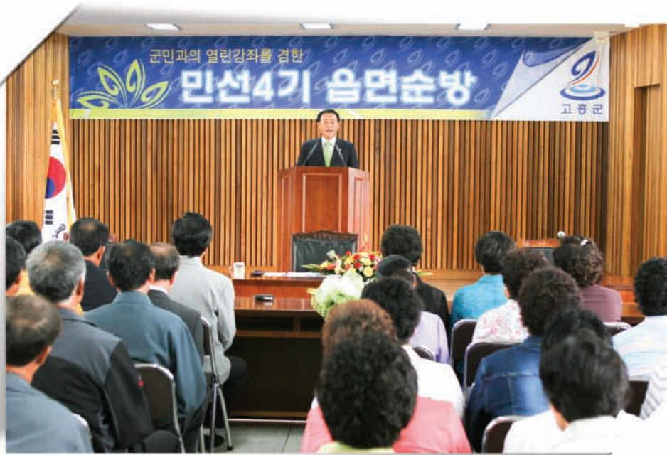
* 민선4기 읍면 순방(2006. 9. 20)