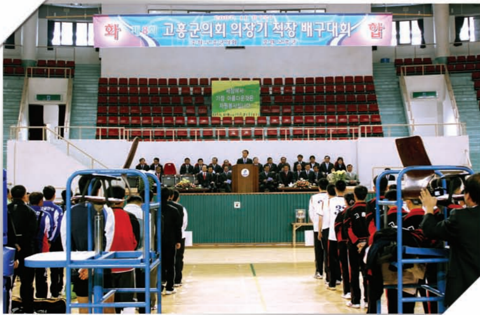
✽ 제8회 고흥군의회 의장기 직장 배구대회 (2007. 11. 8)