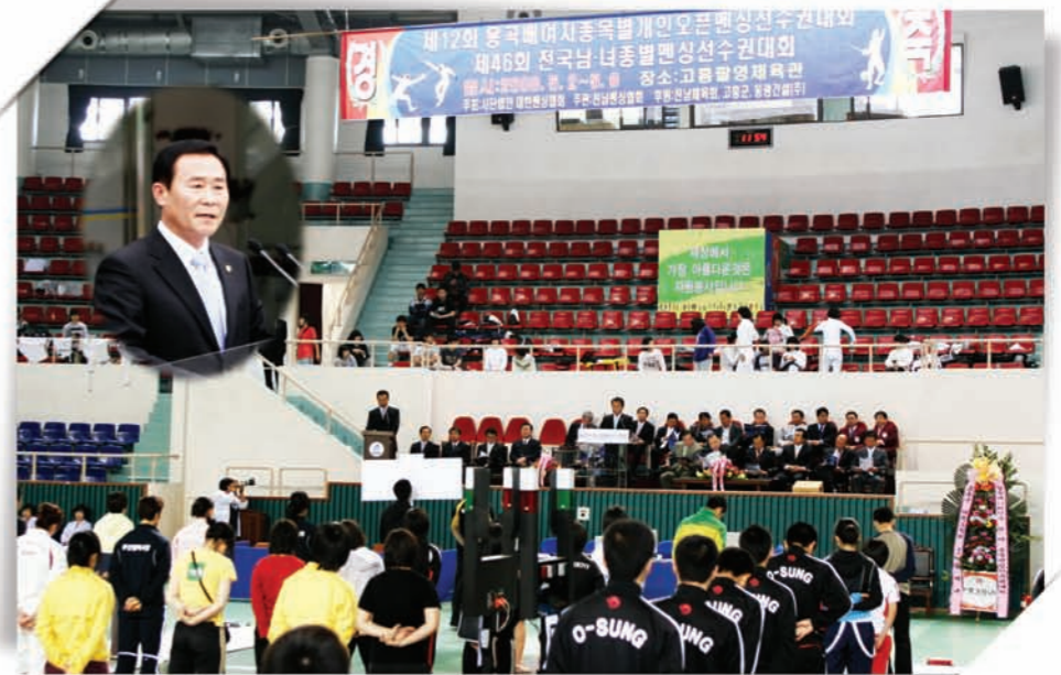
✽ 제46회 전국남녀종별펜싱선수권대회 (2008. 5. 2)