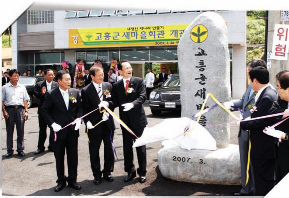
* 고흥군새마을회관 개관식 (2007. 7. 26)