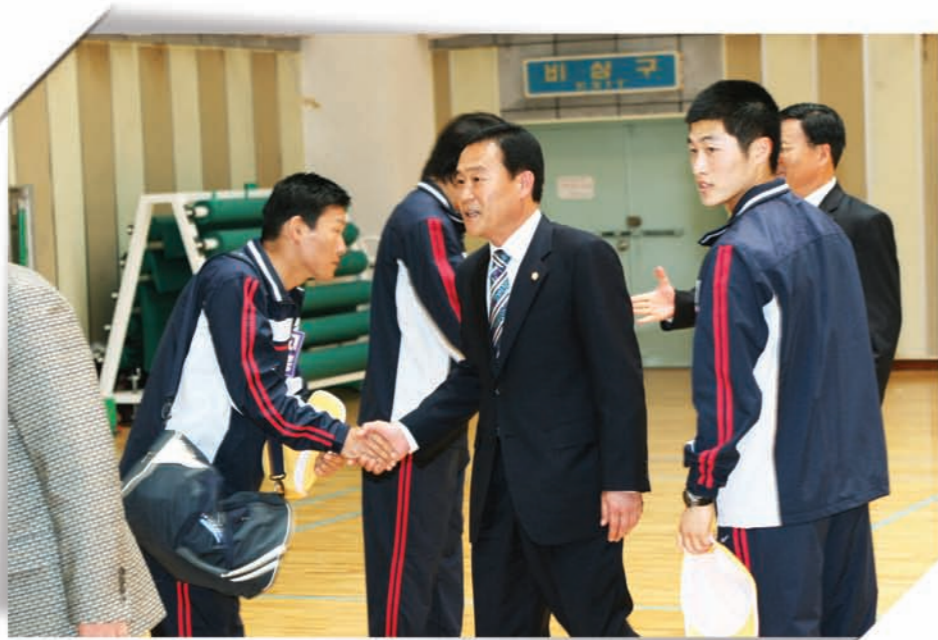
* 제46회 전라남도 도민체육대회 고흥군 선수단 결단식 (2007. 4. 24)