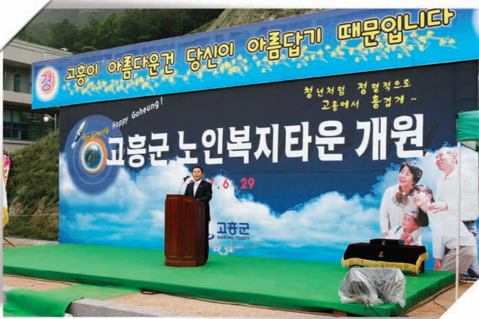
* 노인복지타운 개원식 (2007. 6. 29)