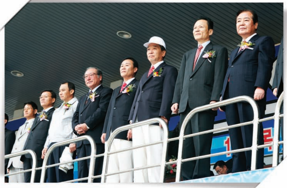
✧ 제33회 군민의날 행사 (2007. 11. 1)