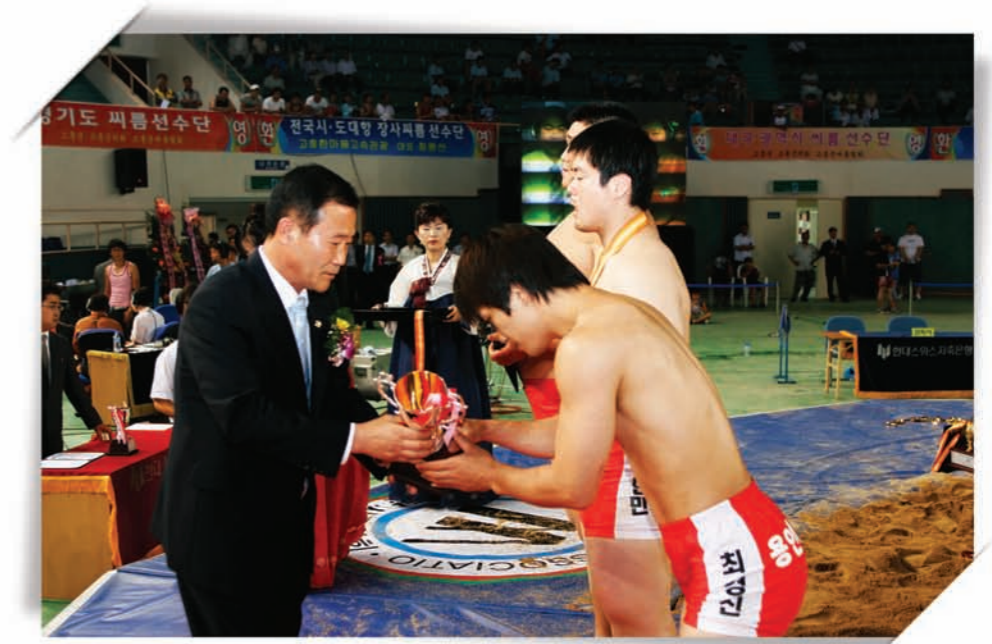
* 제21회 시·도 대항장사 씨름대회 (2007. 7. 30)