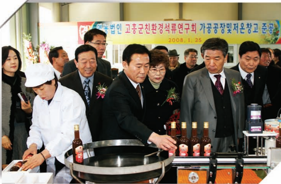
✽ 고흥군 친환경석류연구회 가공공장 및 저온창고 준공식 (2008. 1. 25)