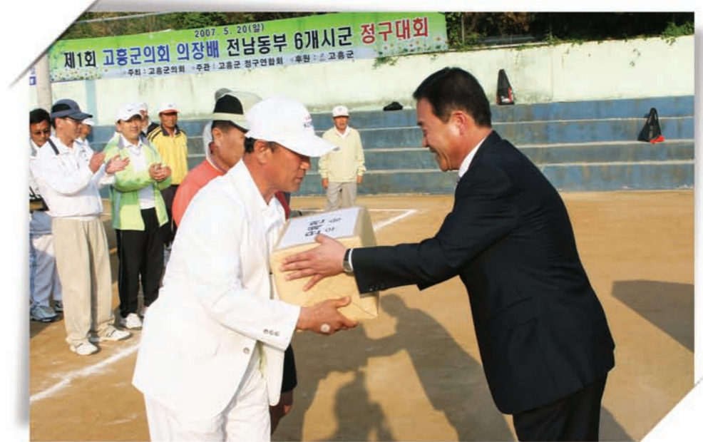
* 제1회 고흥군의회 의장배 전남동부 6개시·군 정구대회 (2007. 5. 20)