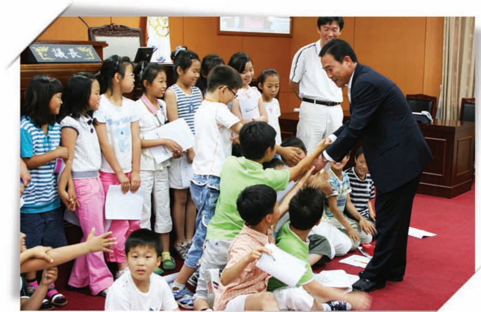
* 고흥동초등학교 본회의장 견학 (2007. 6. 20)