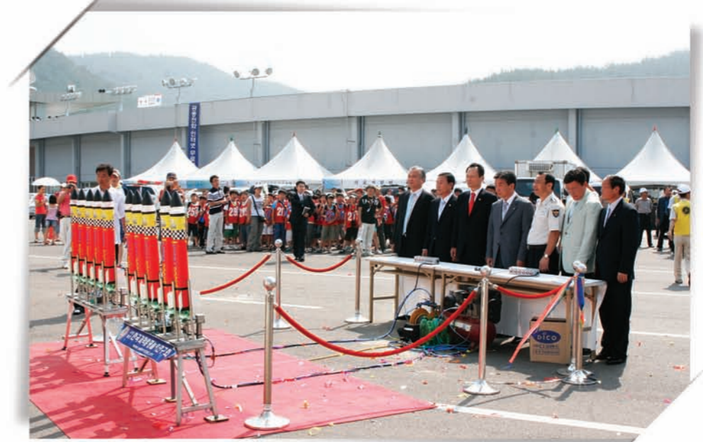
* 2007 우주항공축제 (2007. 7. 28)