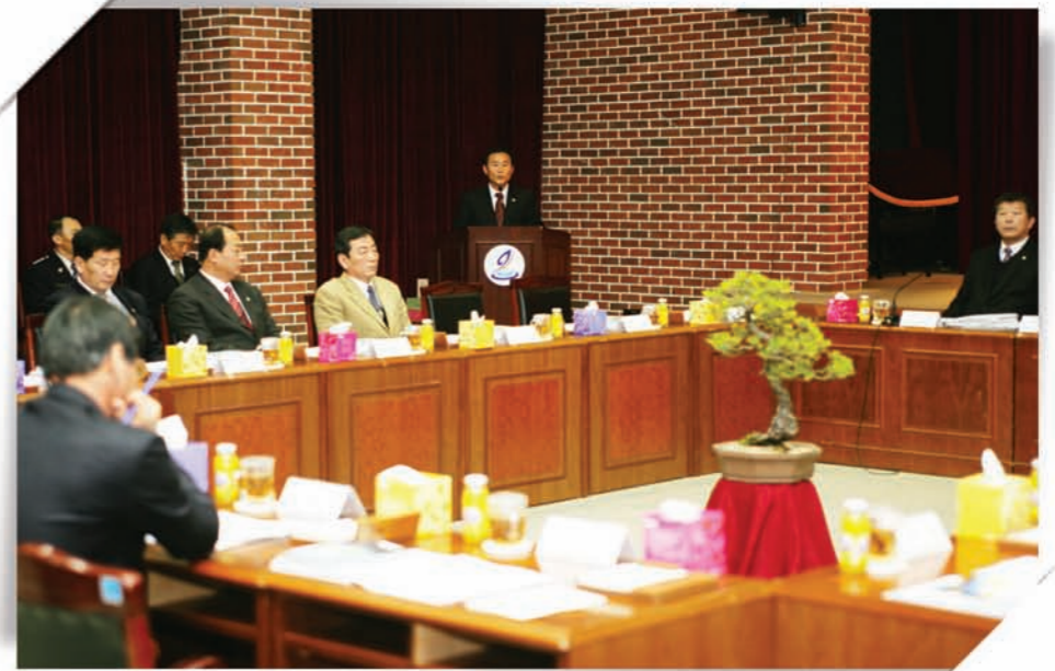
✽ 제132차 전라남도 시·군의회 의장회의 (2008. 2. 1)