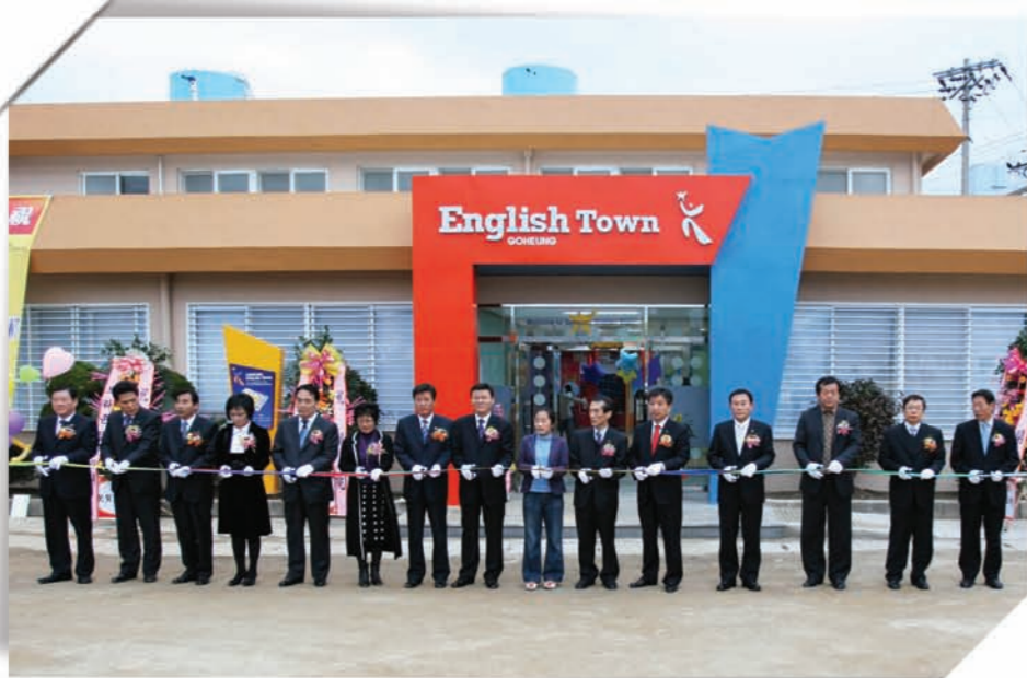
* 영어타운개원식 (2007. 2. 13)