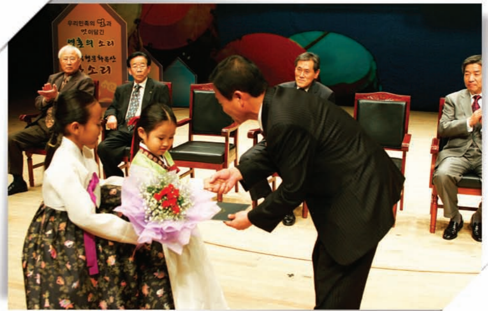
✧ 제10회 고흥동초국악제 전국판소리 경연대회 (2007. 10. 31)