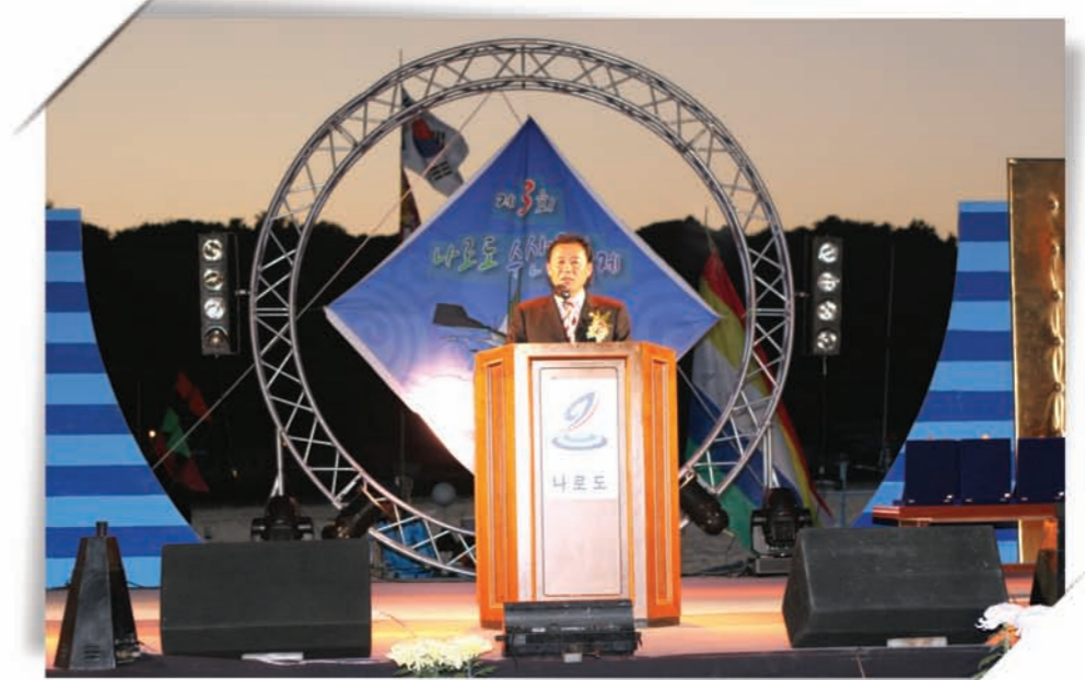
* 제3회 나로도 수산물 축제(2006. 10. 28)