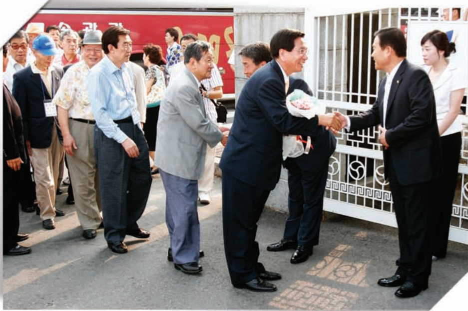
✧ 재경향우회 고향순례 환영식 (2007. 8. 3)