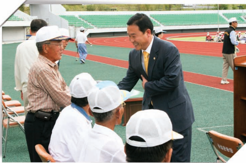
* 제5회 고흥군노인회장기 게이트볼대회(2006.9.8)