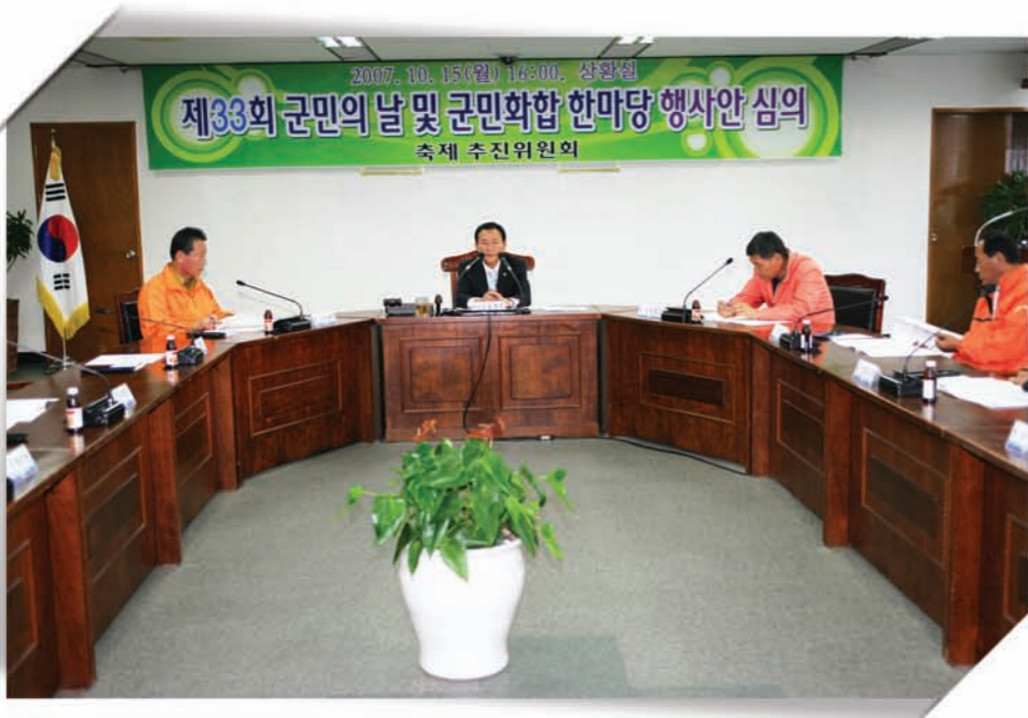
✧ 제33회 군민의날 행사안 심의 (2007. 10. 15)