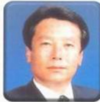
간 사 이 재 후 (남양면)