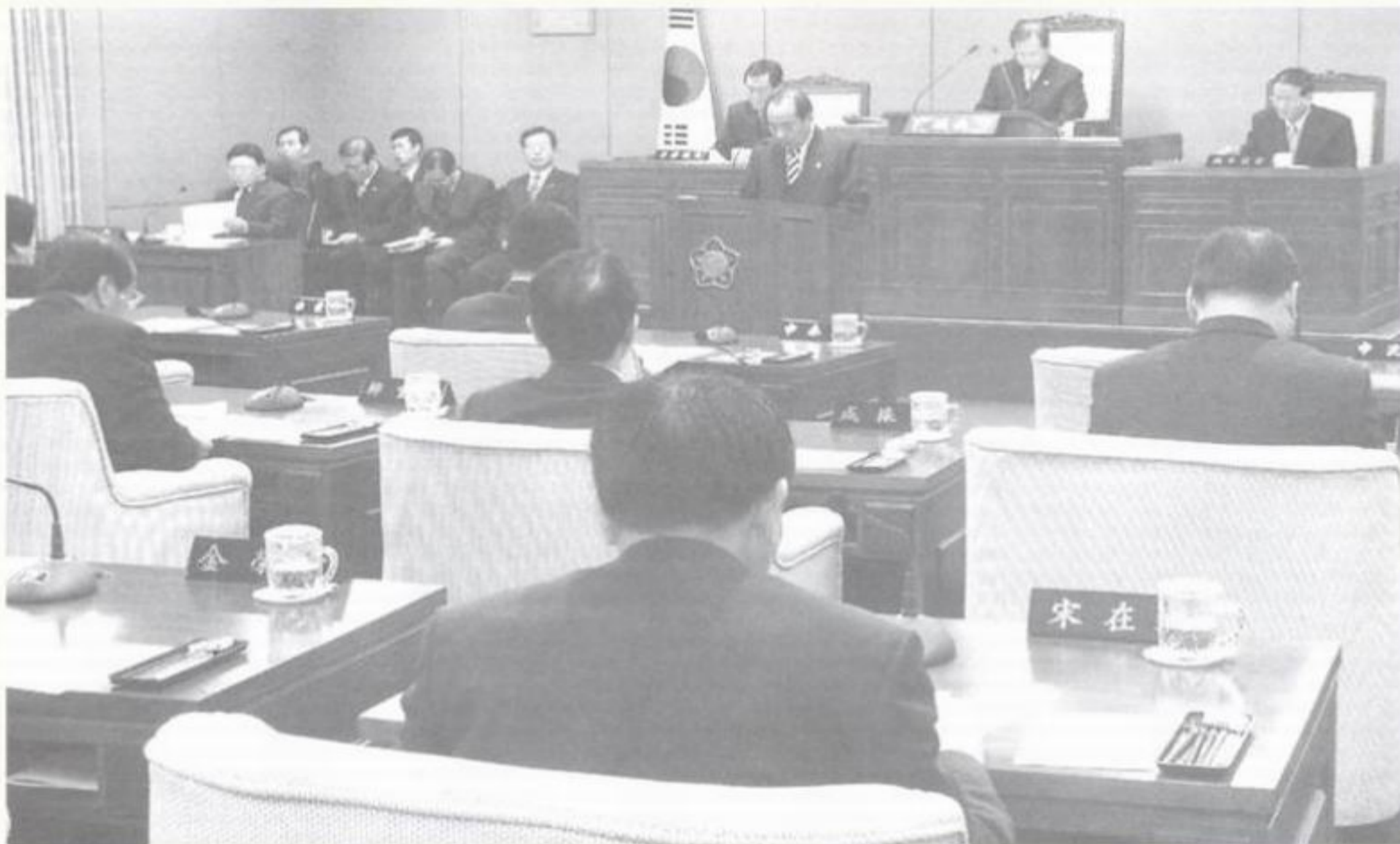
▲ 본회의 전경