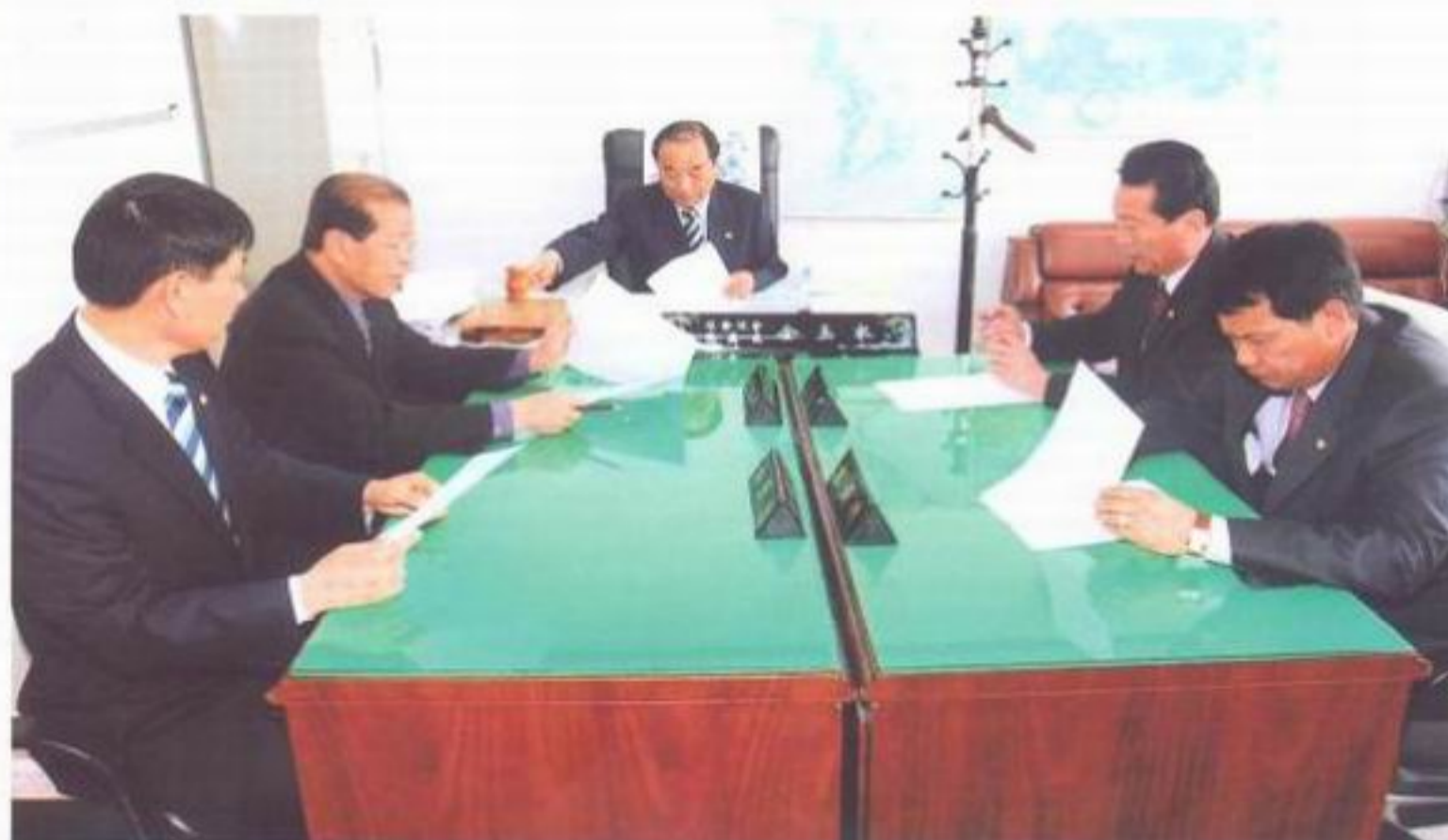
「의회운영위원회 업무보고 장면」