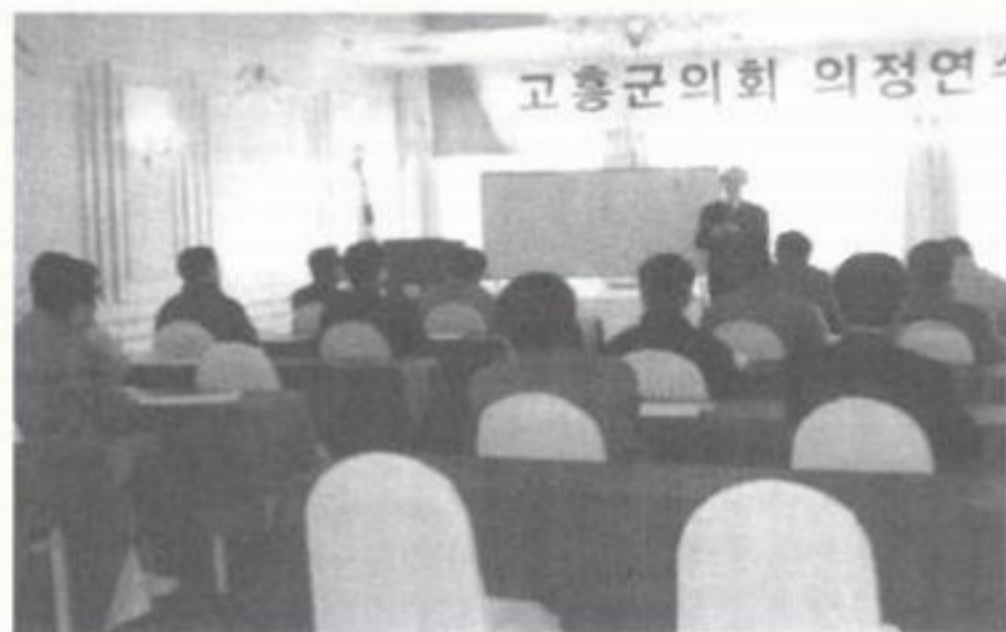
▲ 고흥군의회의원 연수

회운영에 지장이 없는 범위내에서 지방의회의 위상과 의원의 자질향상을 위해 의정 연수를 지속적으로 추진해 나갈 계획이다.