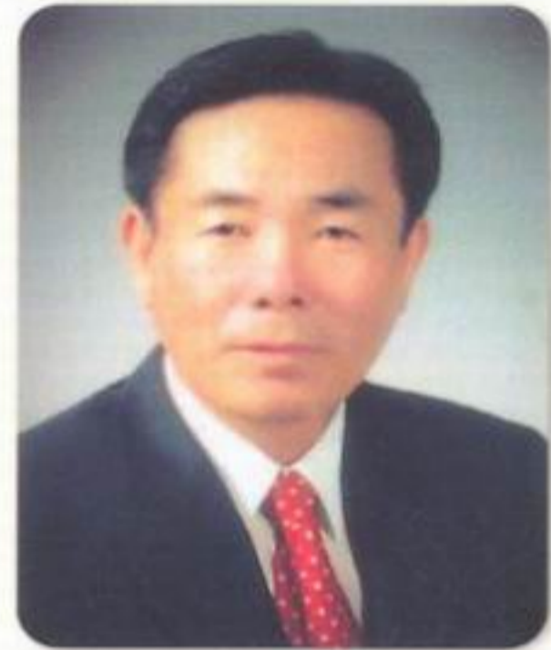
송 재 효 의원