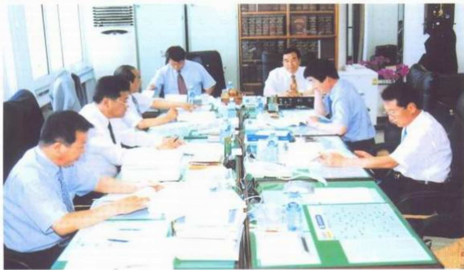
「총무위원회 업무보고 장면」