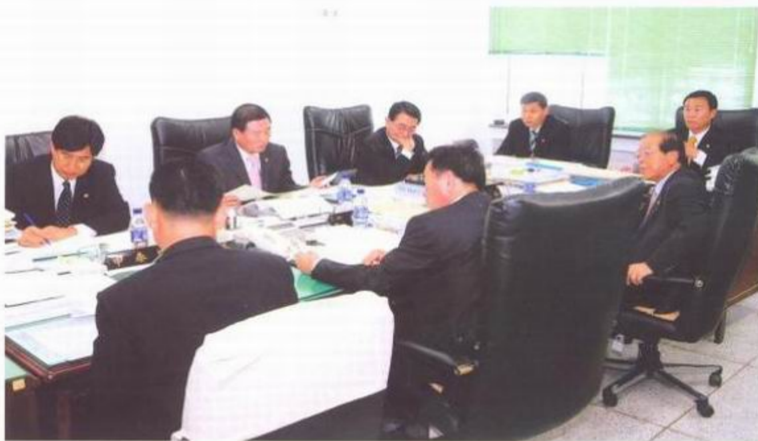
「산업건설위원회 업무보고 장면」