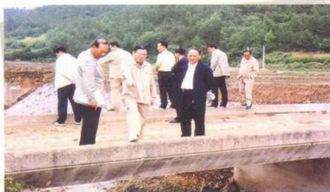
풍양면 매곡리 백석천 수해복구공사