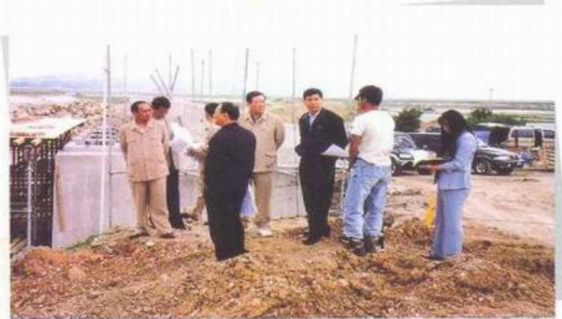
풍양면 보천리 엄포교 수해복구공사