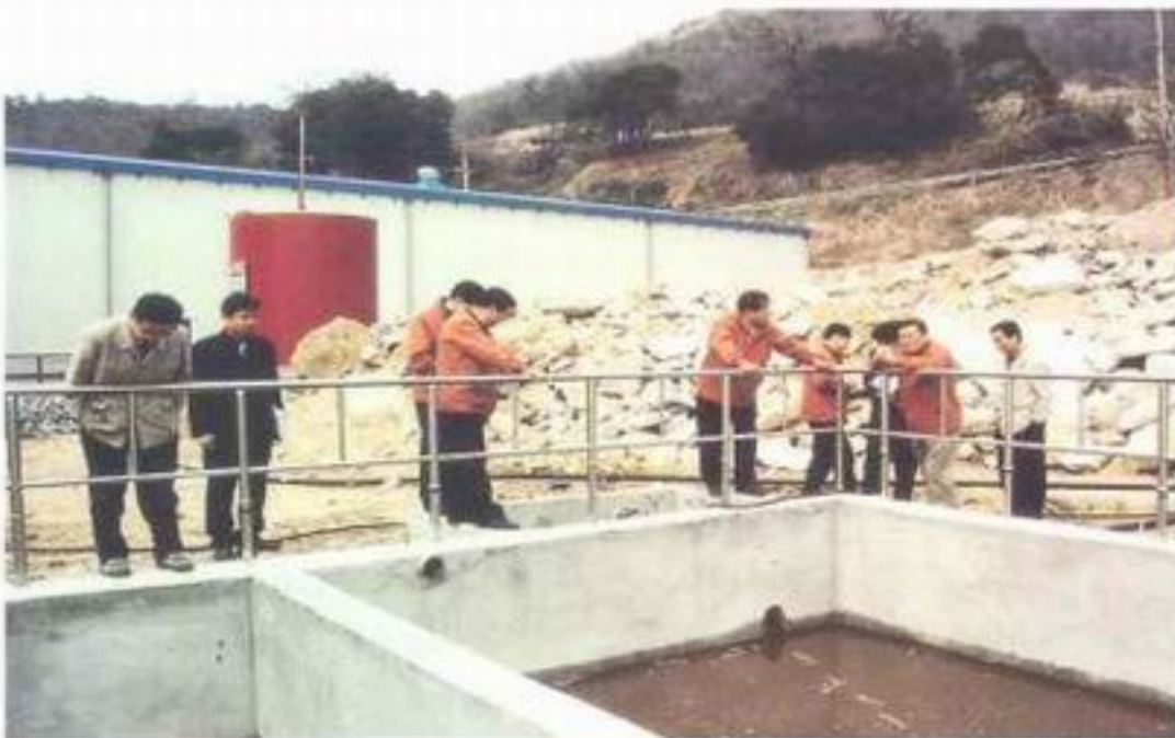
오천 미역가공공장 폐수처리시설공사(금산면)