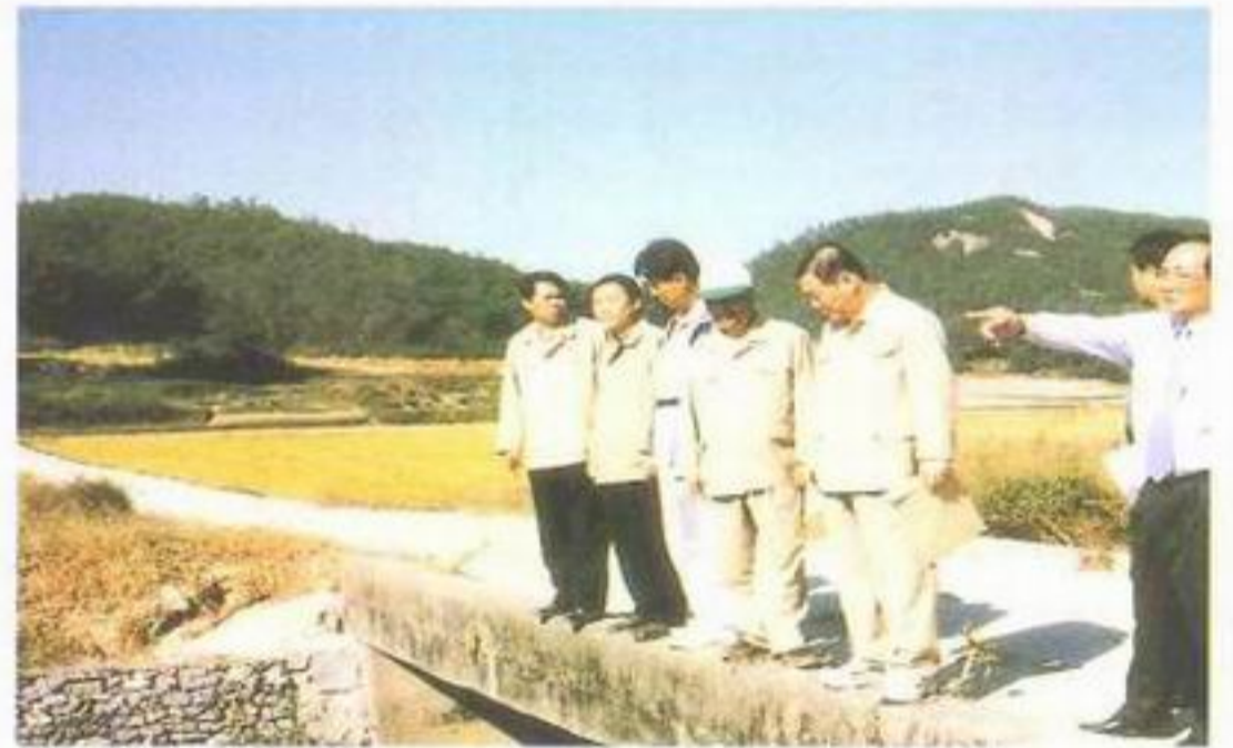
호덕 배수로 공사(과역면)