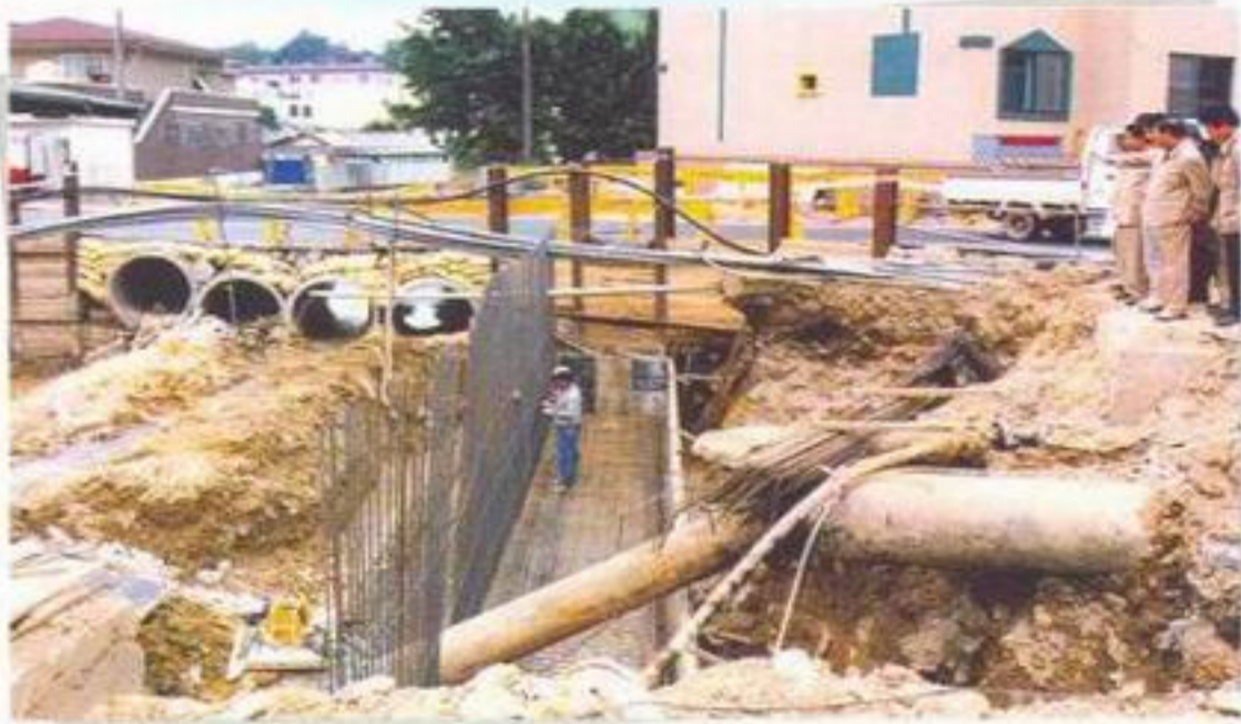
고흥읍 남계리 학림천 수해복구공사