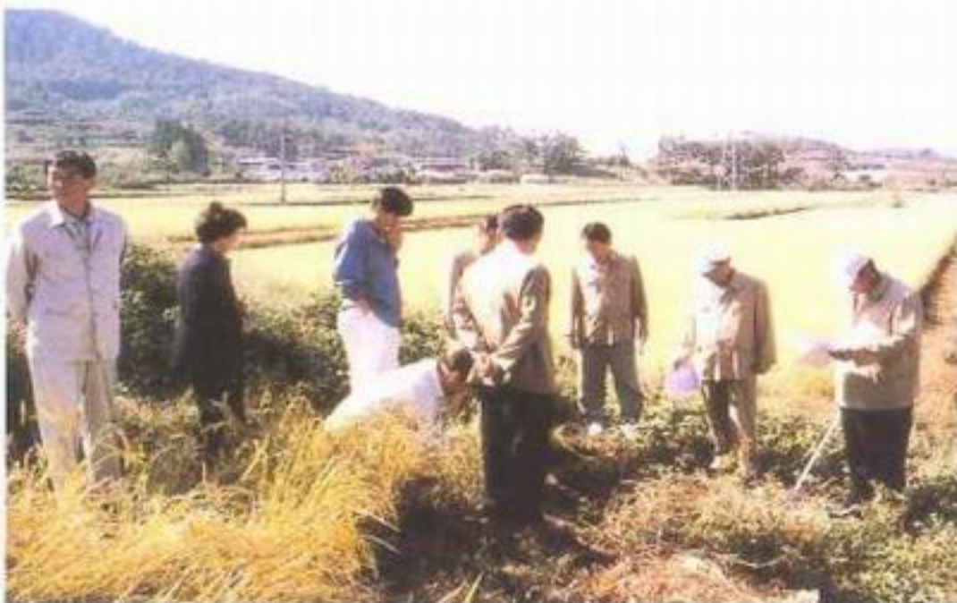
운교 배수로 공사(남양면)