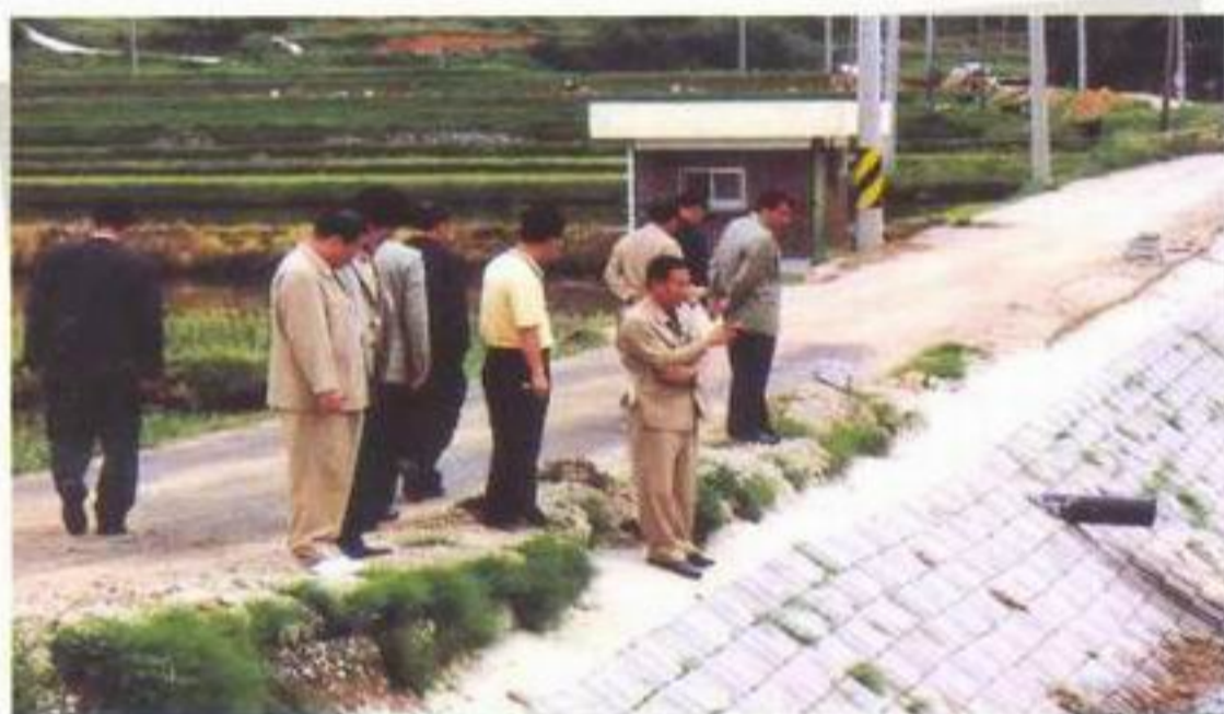
풍양면 매곡리 동적천 수해복구공사