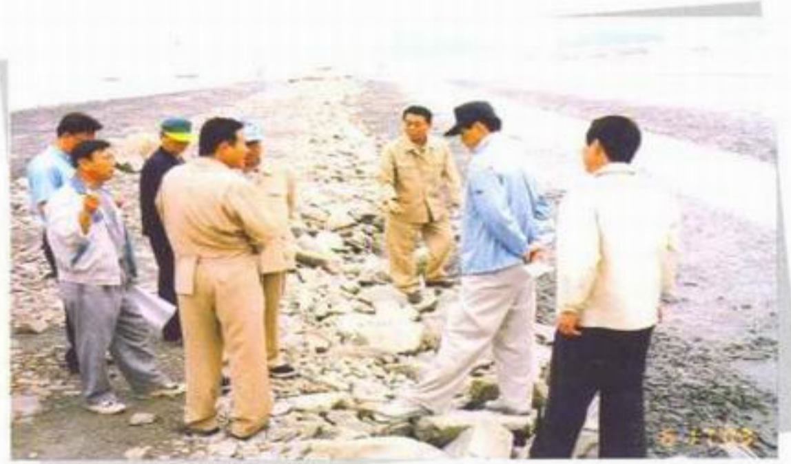
남양면 월정리 왕주방조제 수해복구공사