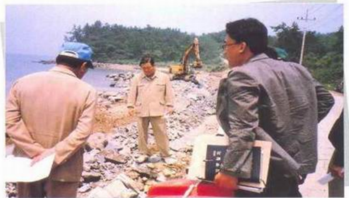
도양읍 장계리 군도 2호선(잠두) 수해복구공사