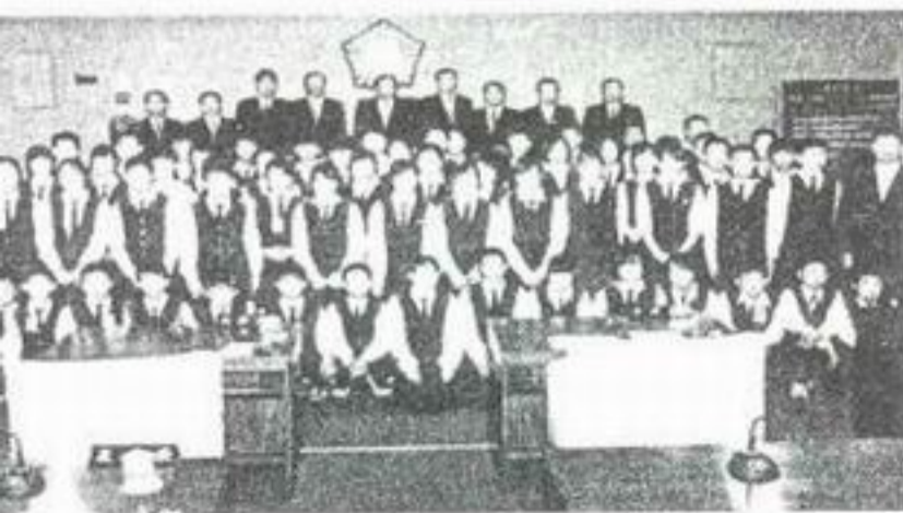
봉래중학생들이 10월 7일 의회를 방문하여 의원들과 기념촬영을 했다.

봉래중학교 학생 65명이 지난 10월 7일 제112회 고흥군의회 임시회 개최식을 방청했다.