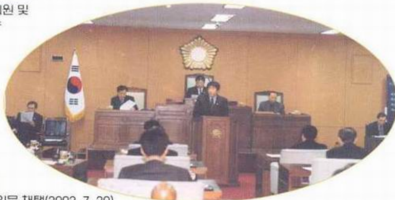
▲ 마늘대책 대정부 건의문 채택(2002. 7. 29)