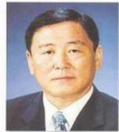
총무위원장 배기홍 의원