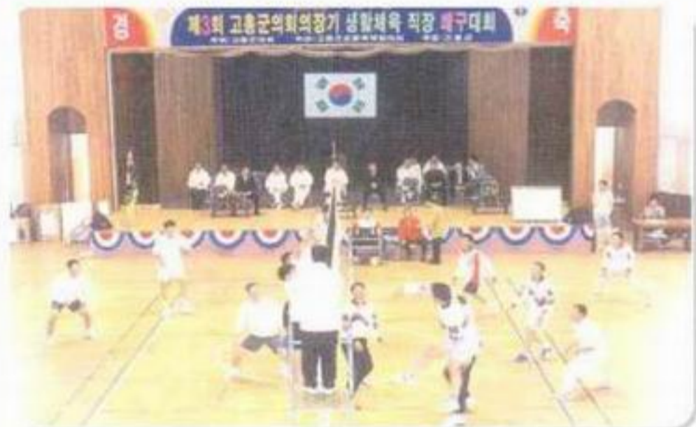
▲ 제3회 군의회의장기 생활체육 직장배구대회(2002. 10. 11)