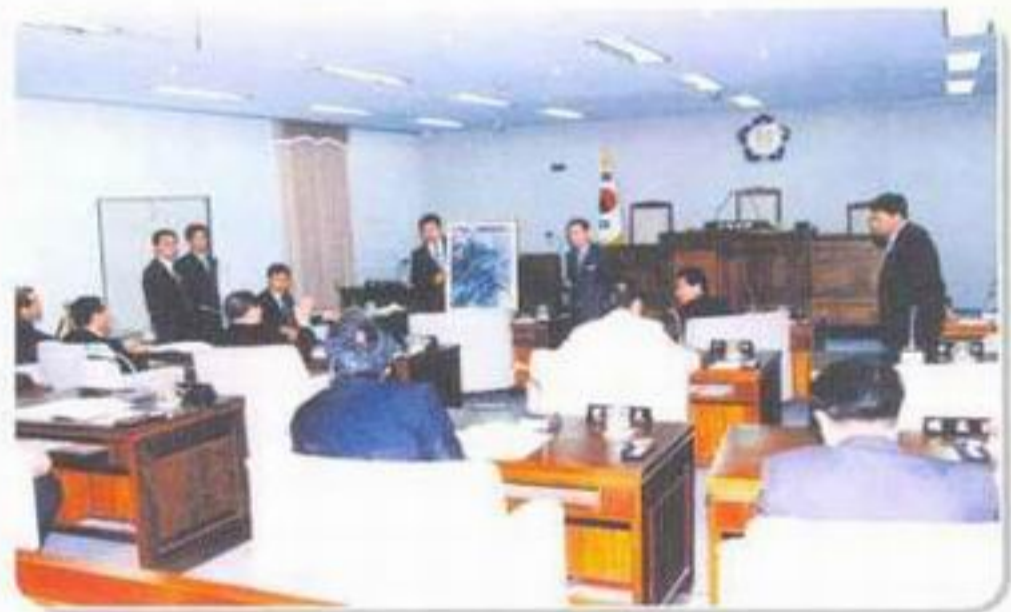
▲ 우주센터 건설사업 추진현황 청취(2002. 7. 30)