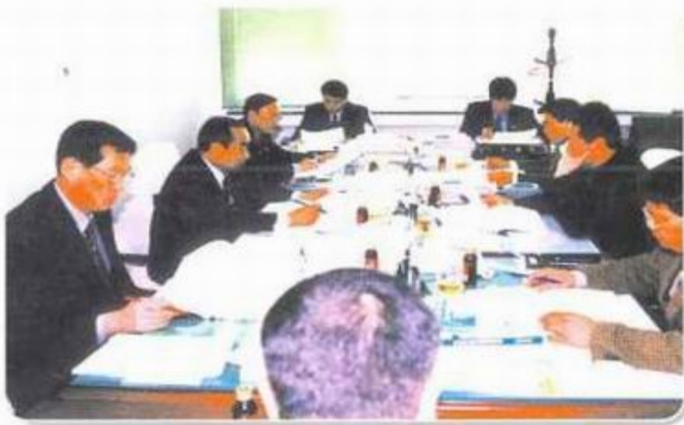
▲ 산업·건설 위원회 2002 행정사무감사