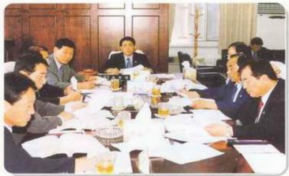
▲ 예산결산 특별위원회 예산안 심사 (2003. 본예산)