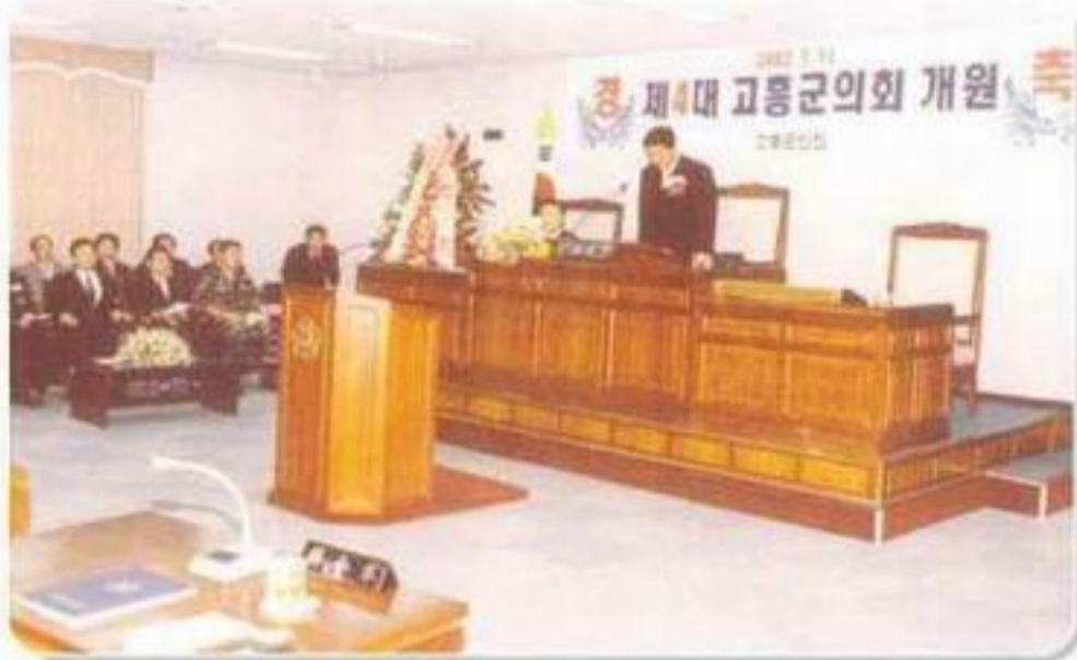
▲ 제4대 고흥군의회 개원식(2002. 7. 11)