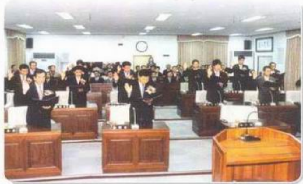
▲ 제4대 고흥군의회 의원 선서(2002. 7. 11)