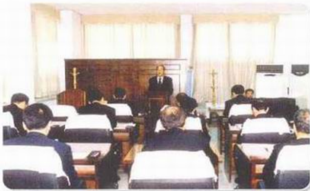
▲ 고흥군 산림조합 사업현황 청취(2002. 10. 25)