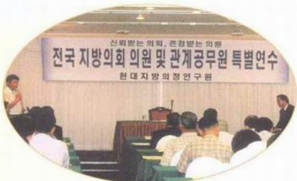
▲ 제1차 정례회 대비 의원 및 관계공무원 특별연수 (2002. 8. 28)