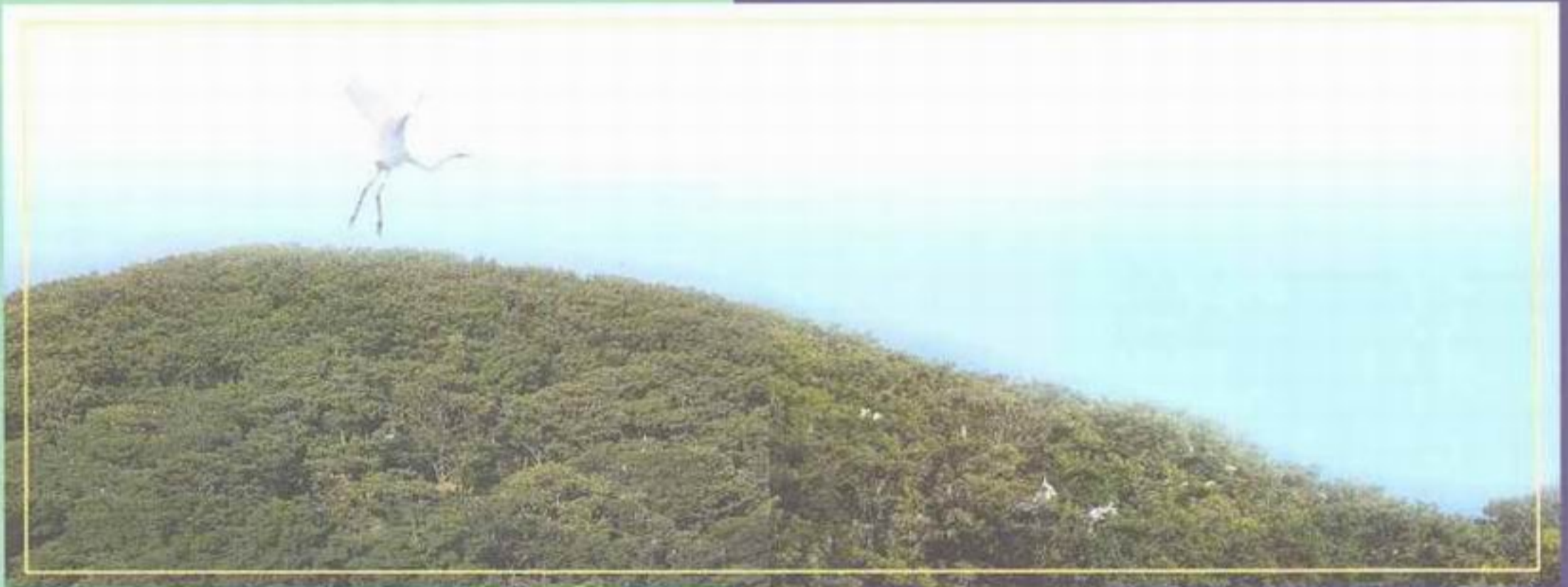
▲ 백로 · 왜가리 도래지(도화면)