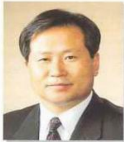
부의장 신광주 의원