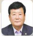
류 동 철 의원