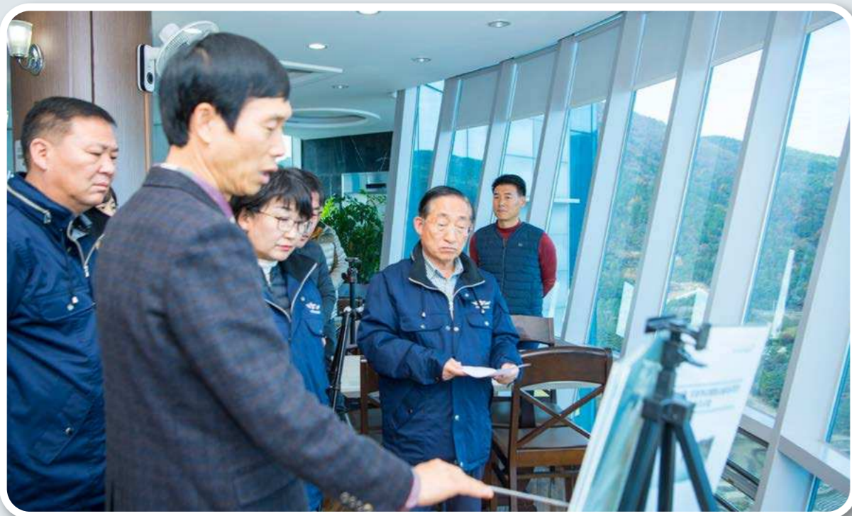
2019년도 행정사무감사 현지조사 (2019. 11. 26.) 고흥 남열지구 모노레일 설치 사업 현장 확인