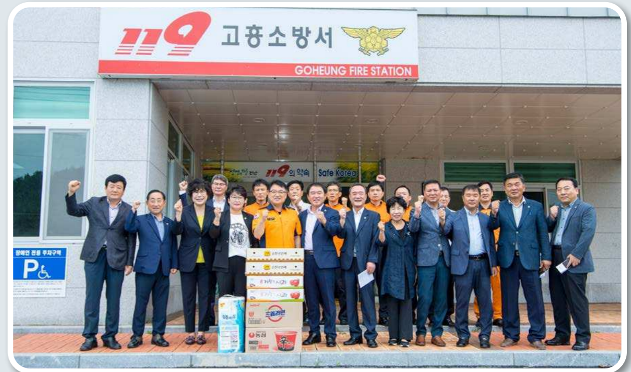
추석 맞이 고흥 소방서 방문 (2019. 9. 9.)