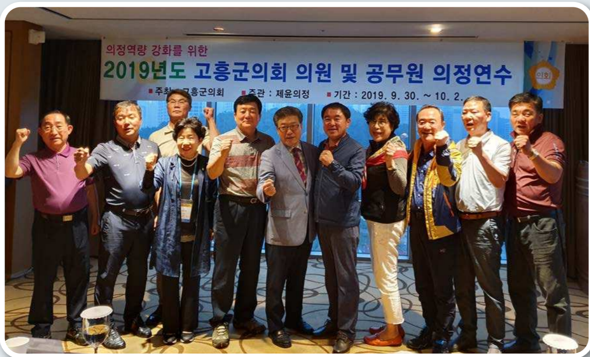
2019 하반기 고흥군의회 의원연수 (2019. 9. 30.)