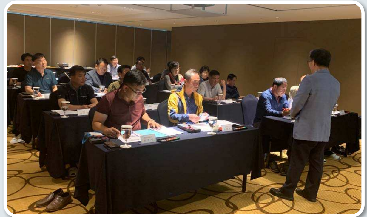
2019 하반기 고흥군의회 의원연수 (2019. 9. 30.)