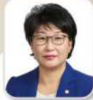
박 미 옥 의원