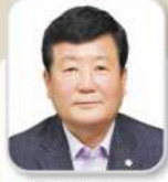
류 동 철 의원