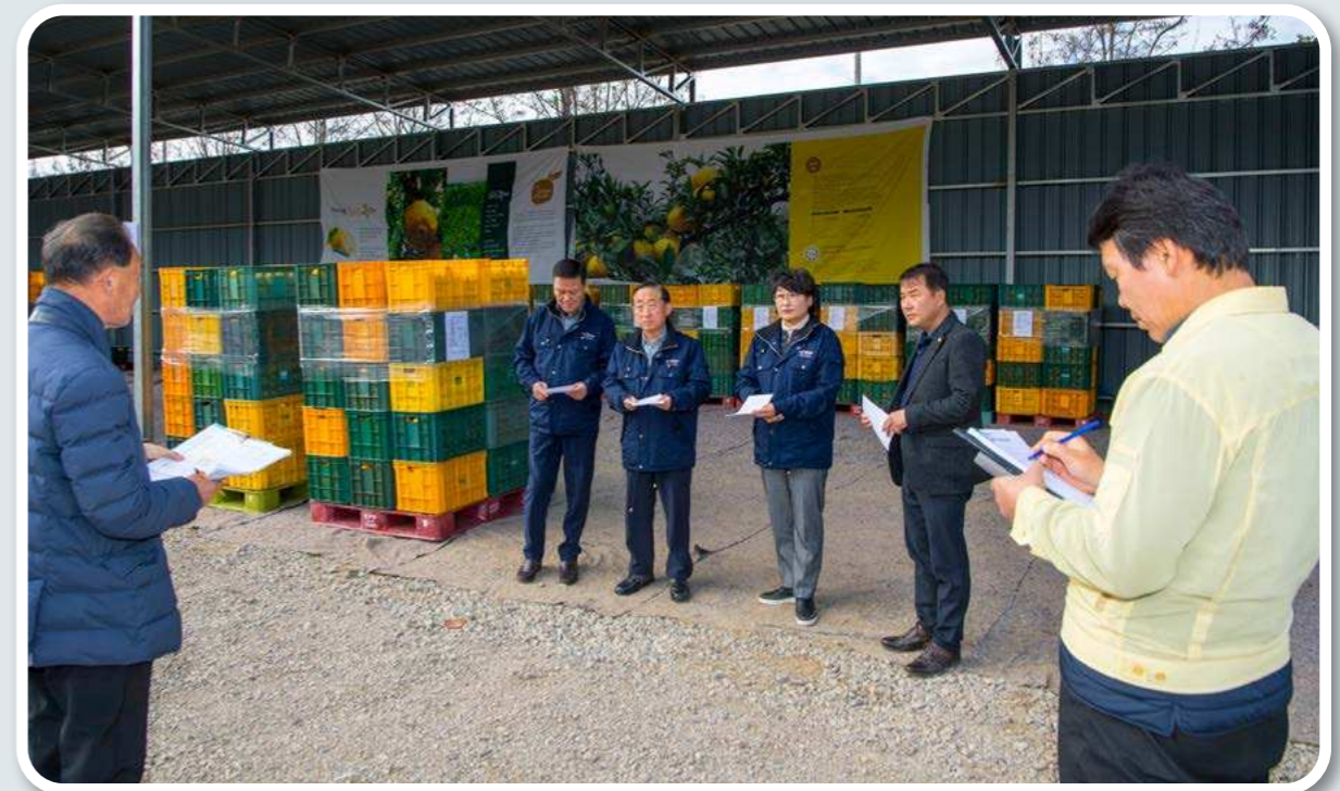
2019년도 행정사무감사 현지조사 (2019. 11. 26.) 고흥 유자 수매장 임시비가림시설 현장 확인