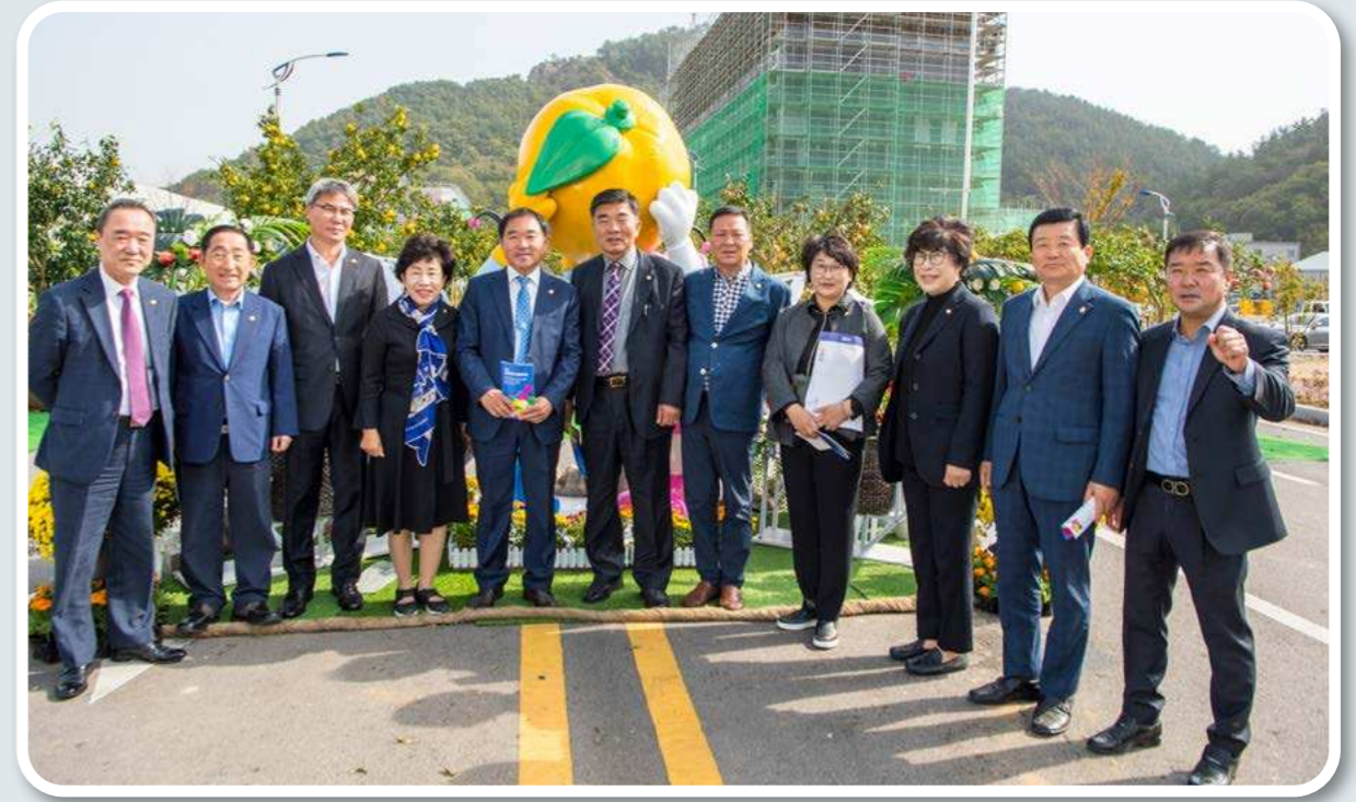
제1회 유자·석류 축제 개막식 (2019. 10. 30.)