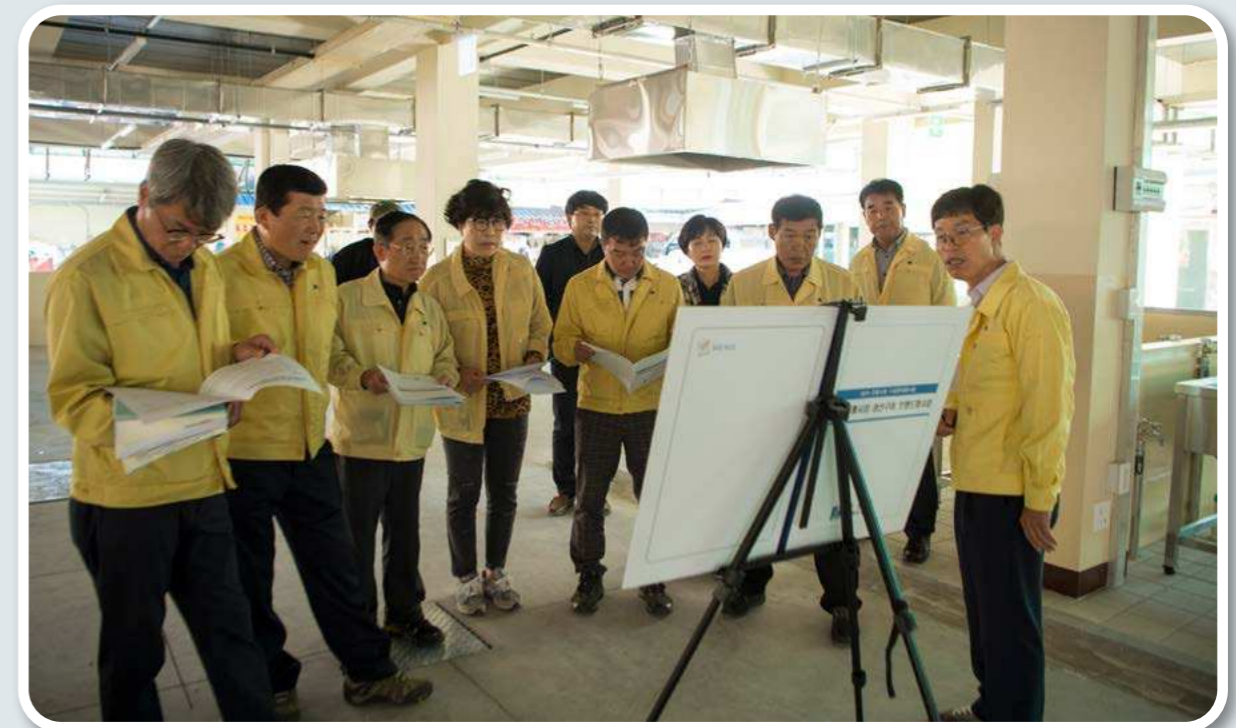
2018~2019년도 군발주사업 행정사무조사 (2019. 10. 25.) 고흥 전통시장 생선구이브랜드화사업 현장 조사