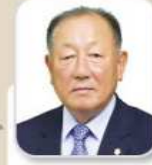
정 중 열 의원