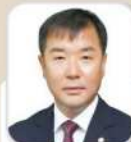
김 민 열 의원