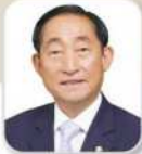
송 영 현 의원