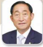
송 영 현 의원