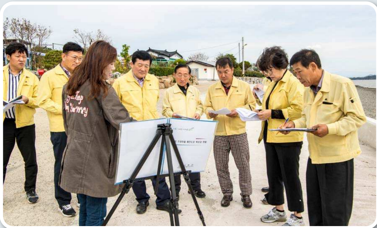
2018~2019년도 군발주사업 행정사무조사 (2019. 10. 23.) 남양 주암마을 해안도로확포장 현장 조사