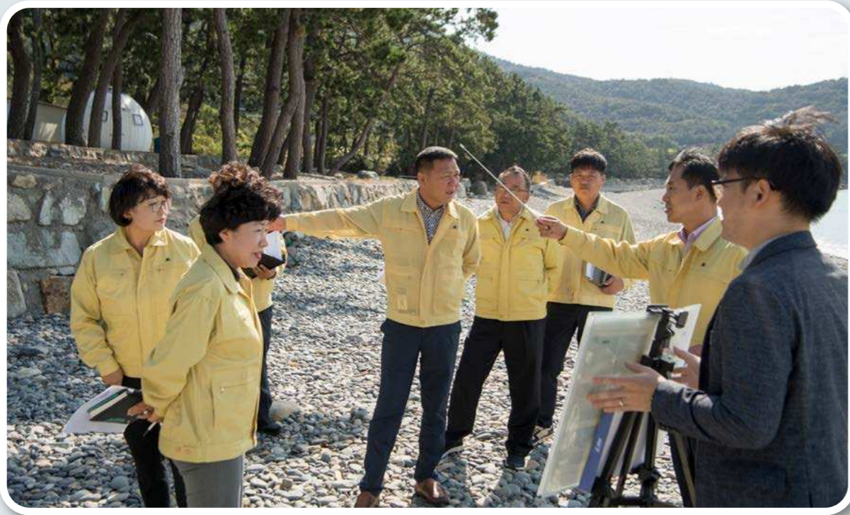
2018~2019년도 군발주사업 행정사무조사 (2019. 10. 22.) 태풍 콩레이 피해 염포해수욕장 재해복구사업 현장 조사