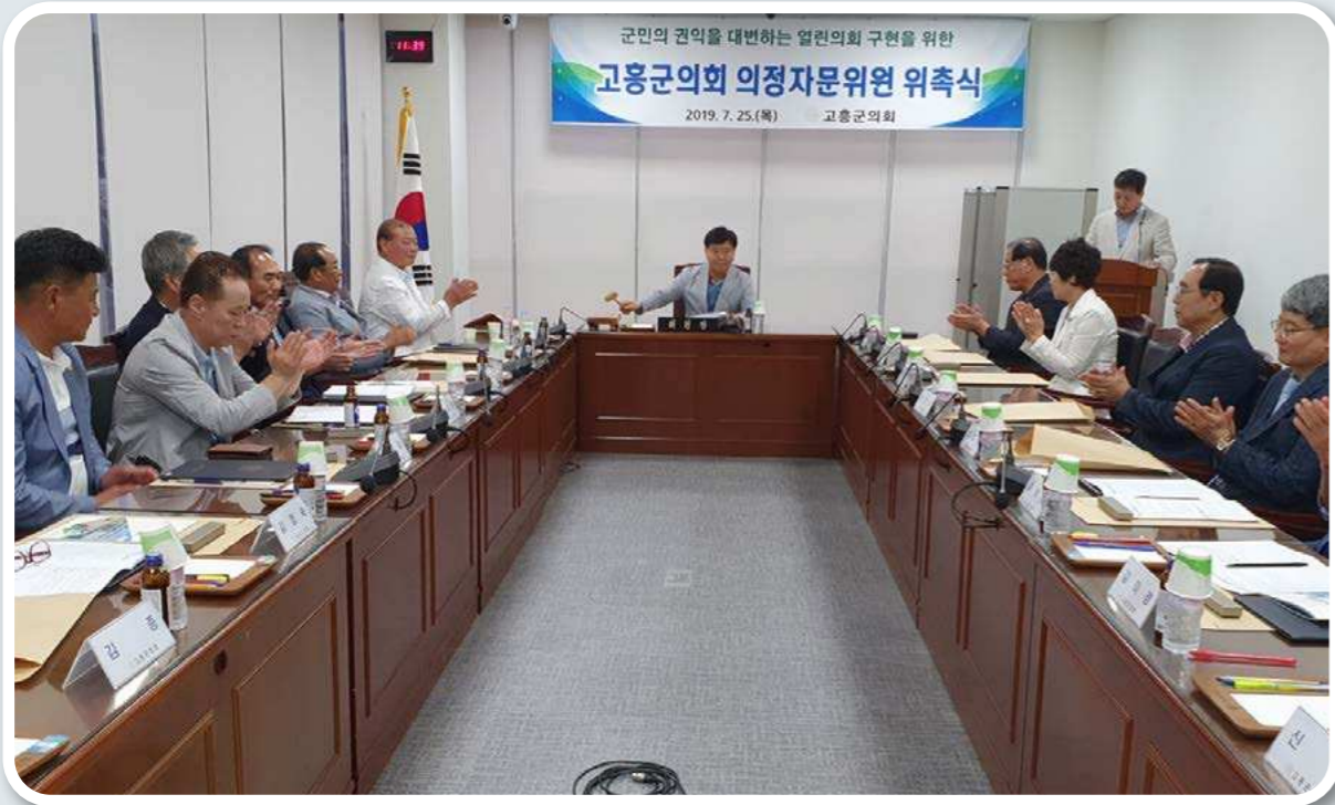
의정자문위원회 위촉식 (2019. 7. 25.)

7월 25일 고흥군의회 소회의실에서 고흥군의회 의정자문위원회 설치 및 운영 조례(19. 2. 22. 제정)에 의거 의정자문위원 위촉식을 가졌다. 16명의 위원이 위촉되었으며, 의정자문위는 앞으로 2년 동안 의회 의원 의정활동에 관한 일반적 자문 및 지방자치 발전을 위한 자문 역할을 하게 된다.