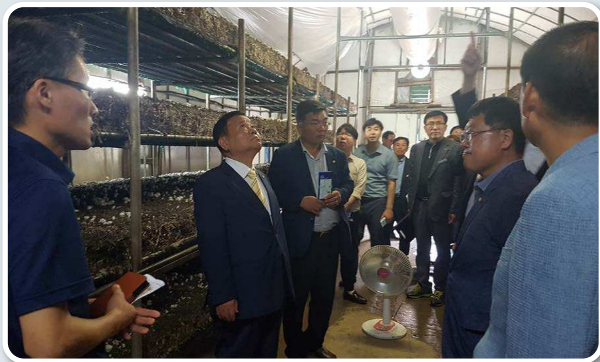
전국도서지역협의회 3분기 정기회의 - 보령시의회 (2019. 7. 29.)