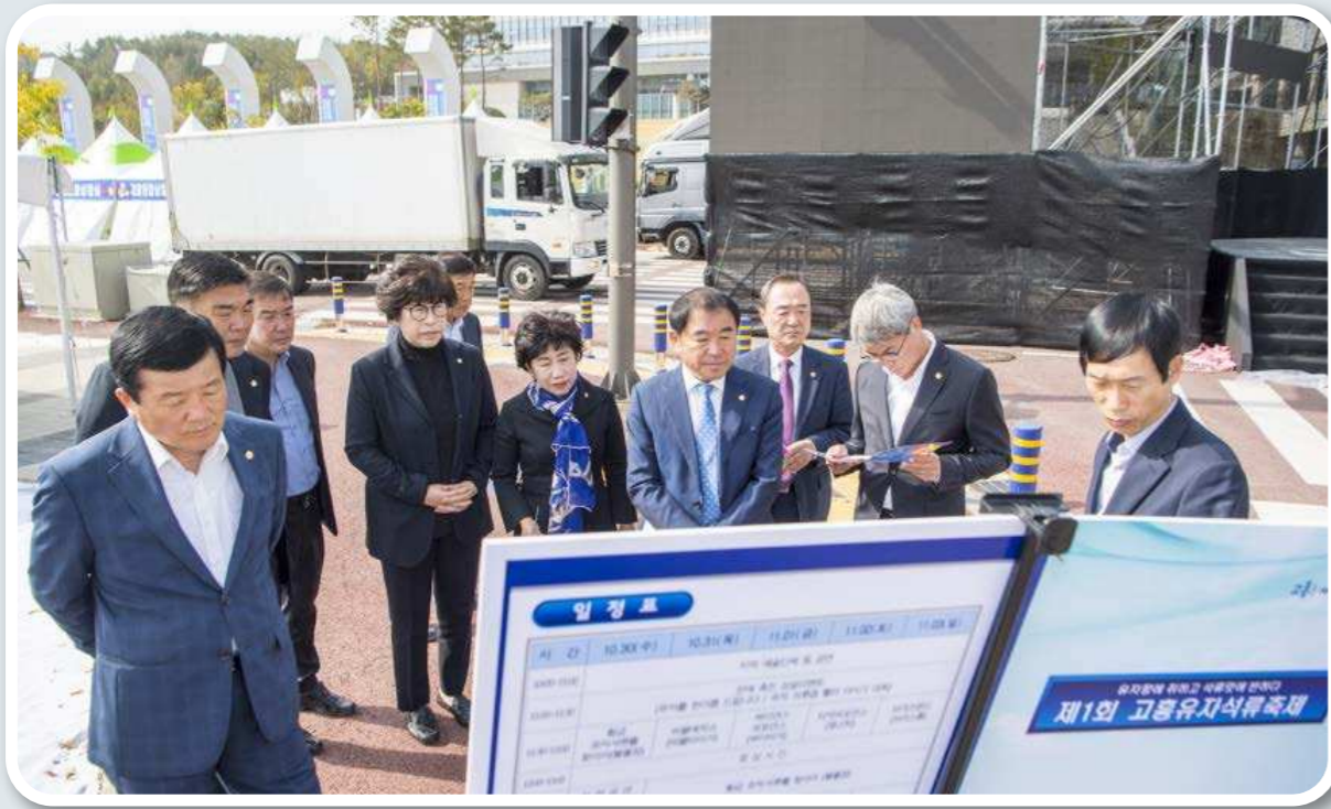
제1회 유자·석류 축제 개막식 (2019. 10. 30.)