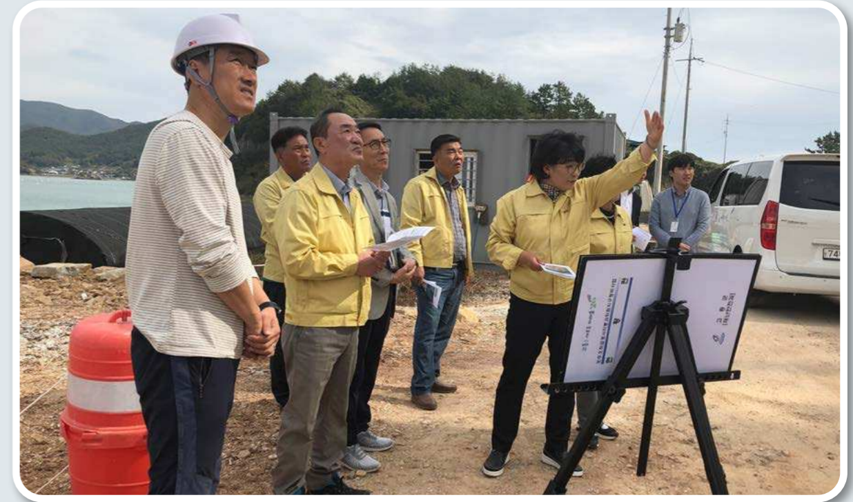
2018~2019년도 군발주사업 행정사무조사 (2019. 10. 23.) 포두 오취 급경사지 붕괴 위험지구 정비사업 현장 조사