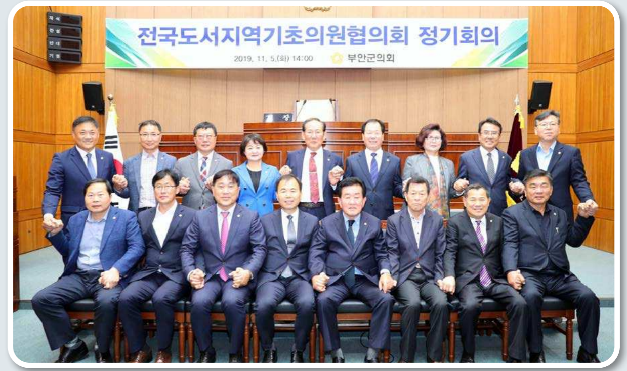
도서지역협의회 4분기 정기회의 - 부안군의회 (2019. 11. 5.)