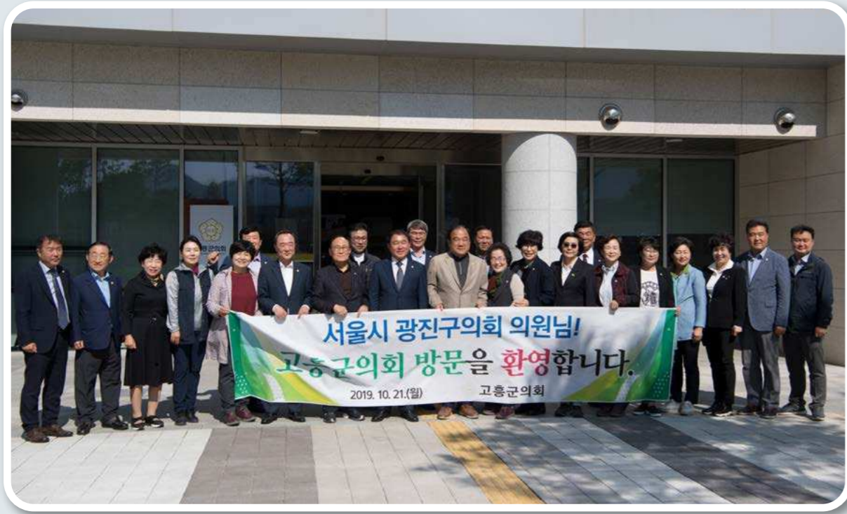
광진구의회와의 간담회 (2019. 10. 21.)