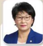
박 미 옥 의원