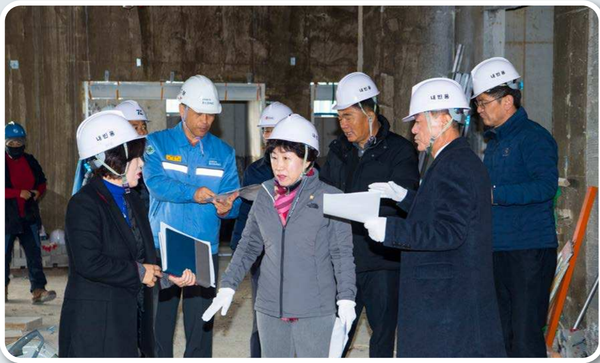
2019년도 행정사무감사 현지조사 (2019. 11. 26.) 고흥 치매안심 요양병원 확충 사업 현장 확인