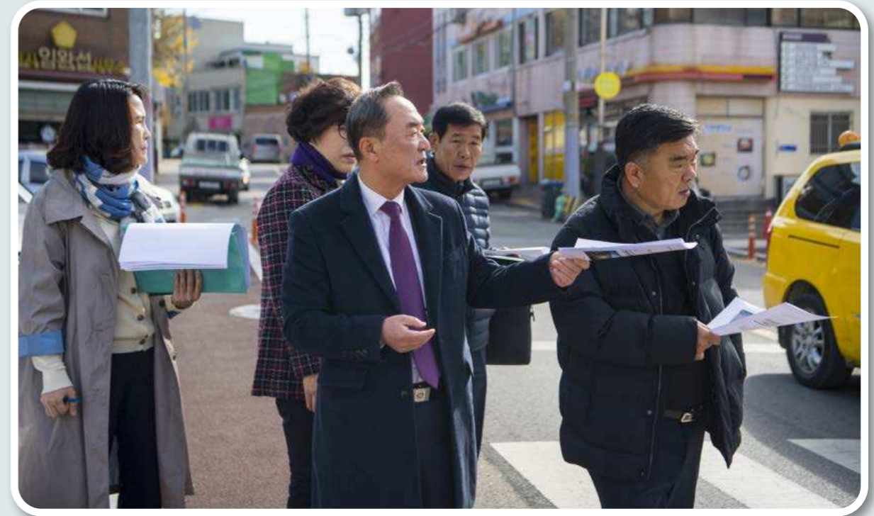
2019년도 행정사무감사 현지조사 (2019. 11. 26.) 목일신 문화예술거리 조성사업 현장 점검