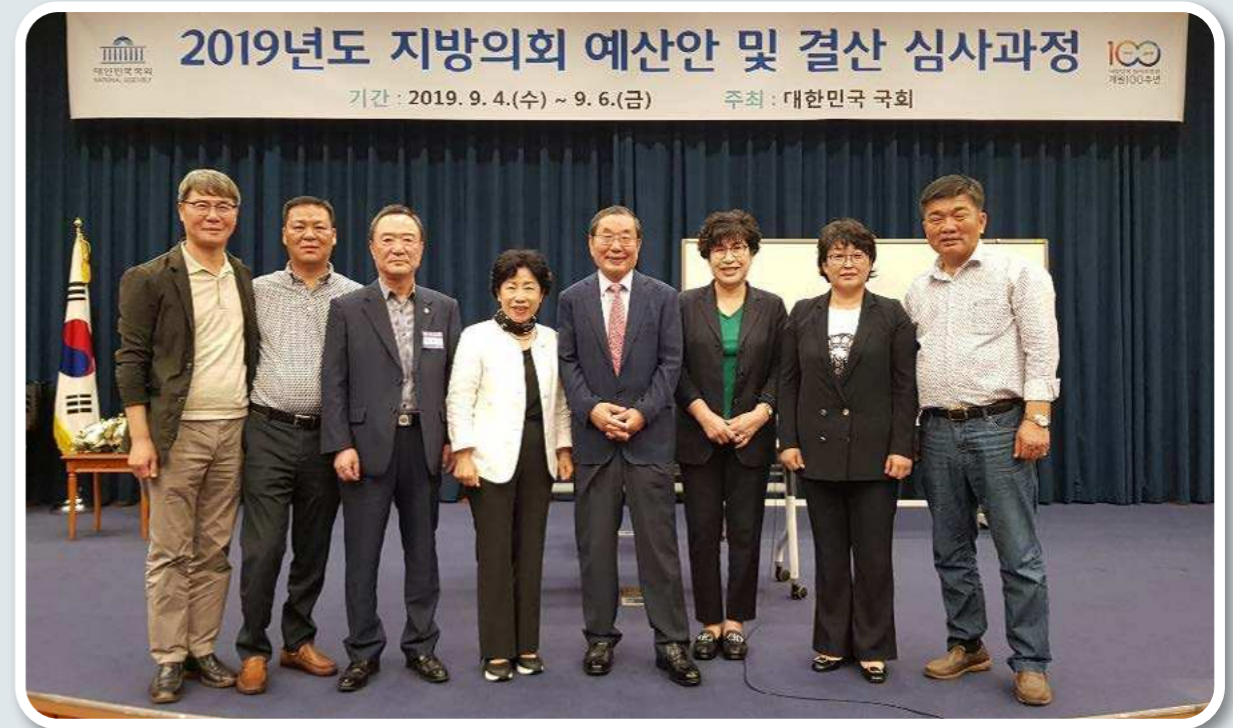
국회사무처 주관 교육 (2019. 9. 4.)

7월 25일 고흥군의회 소회의실에서 고흥군의회 의정자문위원회 설치 및 운영 조례(19. 2. 22. 제정)에 의거 의정자문위원 위촉식을 가졌다. 16명의 위원이 위촉되었으며, 의정자문위는 앞으로 2년 동안 의회 의원 의정활동에 관한 일반적 자문 및 지방자치 발전을 위한 자문 역할을 하게 된다.