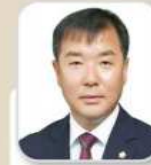
김 민 열 의원