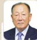
정 중 열 의원